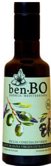
Aceite de oliva ecológico Cosecha en Verde 250ml / 500ml