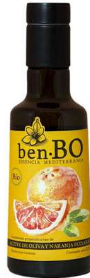
Aceite de oliva ecológico con Naranja 250ml