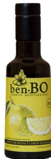
Aceite de Oliva ecológico con Limón 250ml