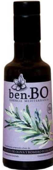
Aceite de oliva ecológico con Romero 250ml